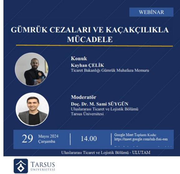
Görsel 5. Gümrük Cezaları ve Kaçakçılıkla Mücadele Webinarı

6 Haziran 2024 tarihinde Ticimax işbirliğinde Üniversite geneline açık olarak “E-Ticaret Sitesi Kurulum Eğitimi” verilmiştir. Görsel 6’da yer verilen eğitim kapsamında katılımcılara sıfırdan bir web sitesi kurarak e-ticaret yapar hale getirilmesine ilişkin bir tam günlük uygulamalı eğitim verilmiştir.